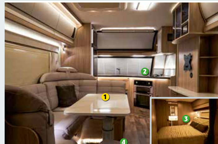
Der Imperial mit zig Lichtebenen hat überall ausreichend viel und vor allem lückenloses Licht. Damit ist er besser als 2018.

angelehnt an DIN EN 12464-1; Farbabstimmung auf zirka 4000 Kelvin