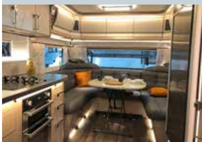
Blick in den Bug des Imperial 600 TDL. Er hat dasselbe Heckbad.

Aus 16 Basis-Grundrissen von 7,67 bis 11,57 Meter (!) Gesamtlänge besteht die Top-Baureihe Imperial. Ab dem 600 TDL lassen sich alle Modelle mit vier bis sieben Flexline-Möbelmodulen, hinter denen sich unterschiedliche Bettformen und -anordnungen verbergen, individualisieren. Die Auswahl wächst somit auf eine enorme Anzahl von Grundrissen. Nur die Modelle 560 XL und FK, die mit kompakteren Luxuscaravans wie Eriba Nova, Fendt Diamant und Tabbert Puccini konkurrieren, muss man quasi nehmen, wie sie sind. Alle Imperial sind 2,50 Meter breit und mit Warmwasserheizung & Co. technisch prall und hochwertig ausgestattet.