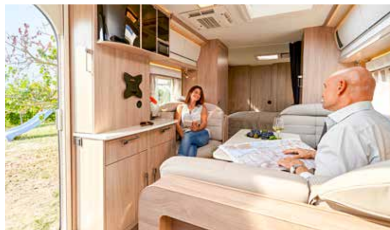
Landkarte oder 1000-Teile-Puzzle auf dem Tisch? Egal, man kann ja nach gegenüber ausweichen.

gibt es einen zusätzlichen elektrischen Durchlauferhitzer. Während das Duschwasser über einen Schlauch ins Freie fließt, münden Spül- und Waschbecken in den Abwassertank, der auch ausgeschleift werden kann.