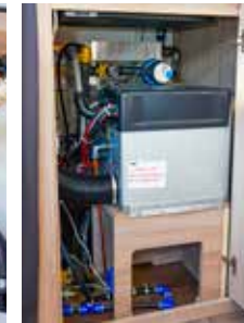
Premiere: Alde-Heizung mit zwei Kreisläufen.