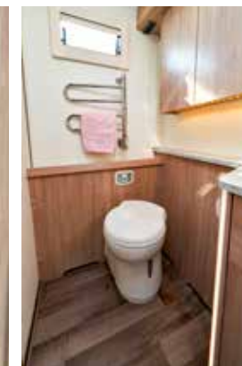
Fast wie daheim: Duschkabine mit solider Tür, Porzellan-WC und elektrisch beheizter Handtuchwärmer. Das Licht ist hell, der Spiegel aber eher klein.