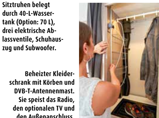
Beheizter Kleiderschrank mit Körben und DVB-T-Antennenmast. Sie speist das Radio, den optionalen TV und den Außenanschluss.