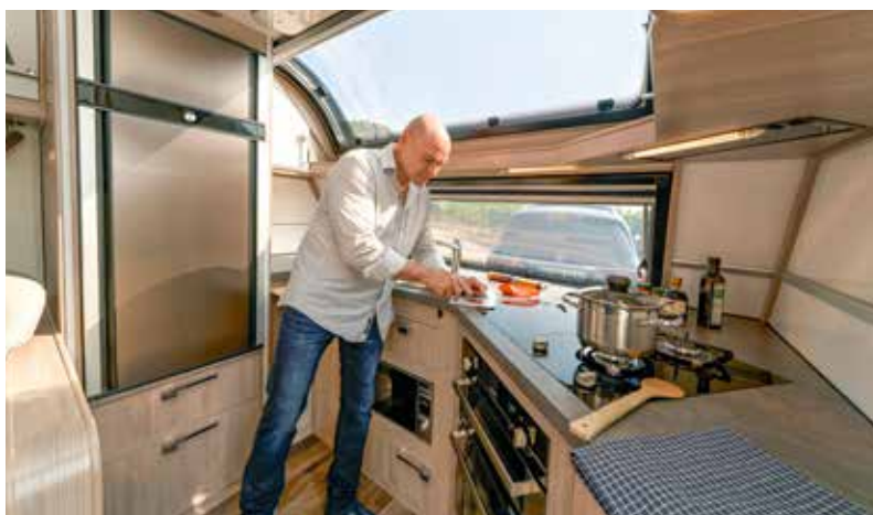
Riesenküche mit allem, was das Herz begehrt. Auf den Induktionsplatten kocht ein Liter Wasser in vier Minuten – dreimal schneller als auf Gas.

... zum Alu- statt GfK-Dach: Die Seitenwände bestehen außen und innen aus Alu. Mit dieser iWall-Technologie gewährleisten wir gute Isolation und Wärmeverteilung im Innenraum sowie die gleichmäßige Wärmeausdehnung des Aufbaus. Durch die Verwendung von Aluminium stellen wir sicher, dass unser Dach denselben Wärmeausdehnungskoeffizienten hat wie unsere Seitenwände. Hierdurch vermeiden wir Spannungsrisse. Des Weiteren wird für die speziell von Kabe entwickelte Abdichtung zwischen Seitenwänden und Dach das Dachblech über das Blech der Seitenwände gebogen. Diese erprobte und sehr haltbare Abdichtung wäre bei der Verwendung von GfK nicht möglich.