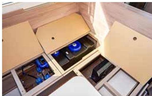
Sitztruhen belegt durch 40-L-Wassertank (Option: 70 L), drei elektrische Ablassventile, Schuhhauszug und Subwoofer.