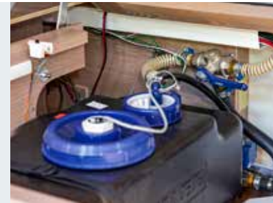
Waschbecken-Abwassertank - die Dusche geht ins Freie.