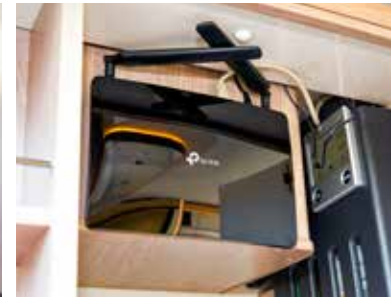
Router für die Vernetzung des Smart-D-Bordsystems und für internes Wlan.

Alein die Aufzählung aller Technik-Komponenten würde den Rahmen dieses Textfeldes sprengen. Also sprechen wir über Funktionen. Die leistungsfähige Lichtanlage, deren Komponenten tadellos eingebaut sind, kann vom zentralen Farbbildschirm aus geschaltet und gedimmt und mit einem Fingertipp als Mood-Light inszeniert werden. Klar muss man sich mit dem Kabe etliche Stunden auseinandersetzen, um alle Komponentenfunktionen zu kennen, was die klar gekennzeichneten Icons auf dem Smart-D-Bildschirm aber vereinfachen. Dann aber freut man sich über warme Füße und warme Handtücher, über voll tönende Lautsprecher samt digitalem Empfang, die Möglichkeit, Frisch- und Abwasser per Tastendruck zu entsorgen und vom Füllalarm überwacht nachzutanken, über das konkurrenzlose Raumklima individuell temperierter Bereiche und Böden, über die Induktionskochfelder, die alles binnen Minuten zum Kochen bringen, über die Mikrowelle für den Snack zwischendurch, den Ofen samt Grill, 14 Steckdosen, neun USB-Ports, die induktive Lade-