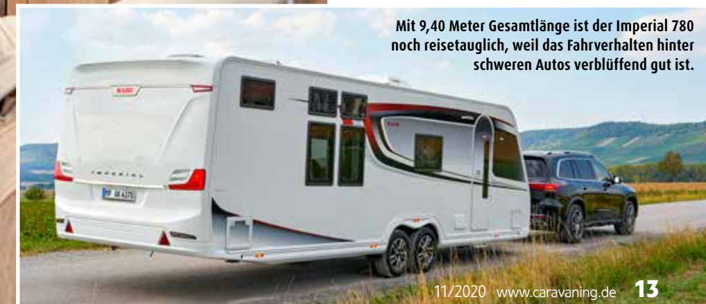
Mit 9,40 Meter Gesamtlänge ist der Imperial 780 noch reisetauglich, weil das Fahrverhalten hinter schweren Autos verblüffend gut ist.

Der Supertest-Kandidat heißt Imperial 780 TDL FK, wobei FK für Frontküche und TDL ungefähr für „Toilette Dusche Large“ steht, was das Großraumbad mit separater Dusche quer im Heck beschreibt. Fürs Bett gibt's nur versteckte Codes: E8 steht für das rechts angeschlagene, 2,03 Meter lange und 1,46 bis 1,16 Meter breite Queens- >>