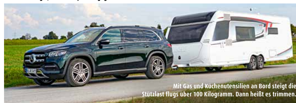
Mit Gas und Küchenutensilien an Bord steigt die Stützlast flugs über 100 Kilogramm. Dann heißt es trimmen.

Die Bugküche des Imperial, die es auch mit weißer Front gibt, liegt unter zwei großen Fenstern. Auch hier hat sich was getan, denn das untere lässt sich jetzt öffnen. Kochdunst saugt die starke Abzugshaube ab, ihn produzieren zwei ultraschnelle 230-Volt-Induktionskochstellen und zwei Gasflammen. Gasgrill und -backofen sind ebenso da wie eine Mikrowelle. Im Auszug unterhalb des zweiseitig zu öffnenden Kühlschranks sind zwei Mülleimer untergebracht, ein Schneidbrett aus Holz steckt gesichert über dem Eckschrank, in dem sich ein zweistöckiges, stabiles Topfkarus-