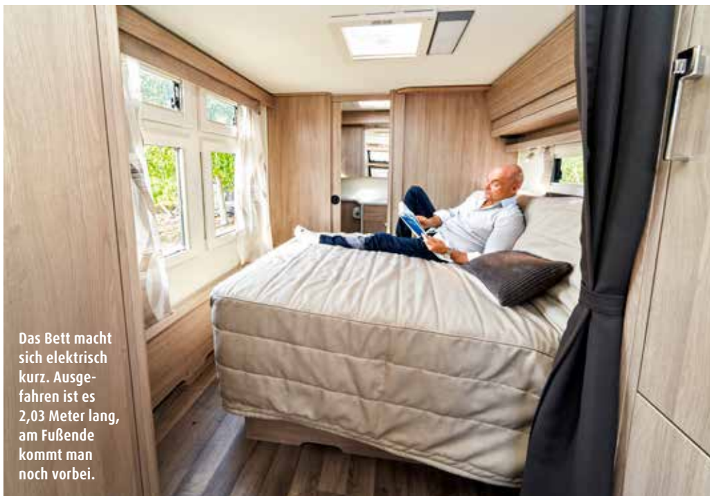
Das Bett macht sich elektrisch kurz. Ausgefahren ist es 2,03 Meter lang, am Fußende kommt man noch vorbei.

Wer aufs Klo muss, geht hier im Wortsinne auf die Keramik. Für eine ausgiebige Dusche in der neuen, soliden Kabine genügt der Boilerinhalt (10 Liter) der Heizung, der Frischwasservorrat von 40 Litern indes ist knapp. Besser noch als in den 70-Liter-Tank ist darum die Investition in den City-Wasseranschluss. Für 480 Euro