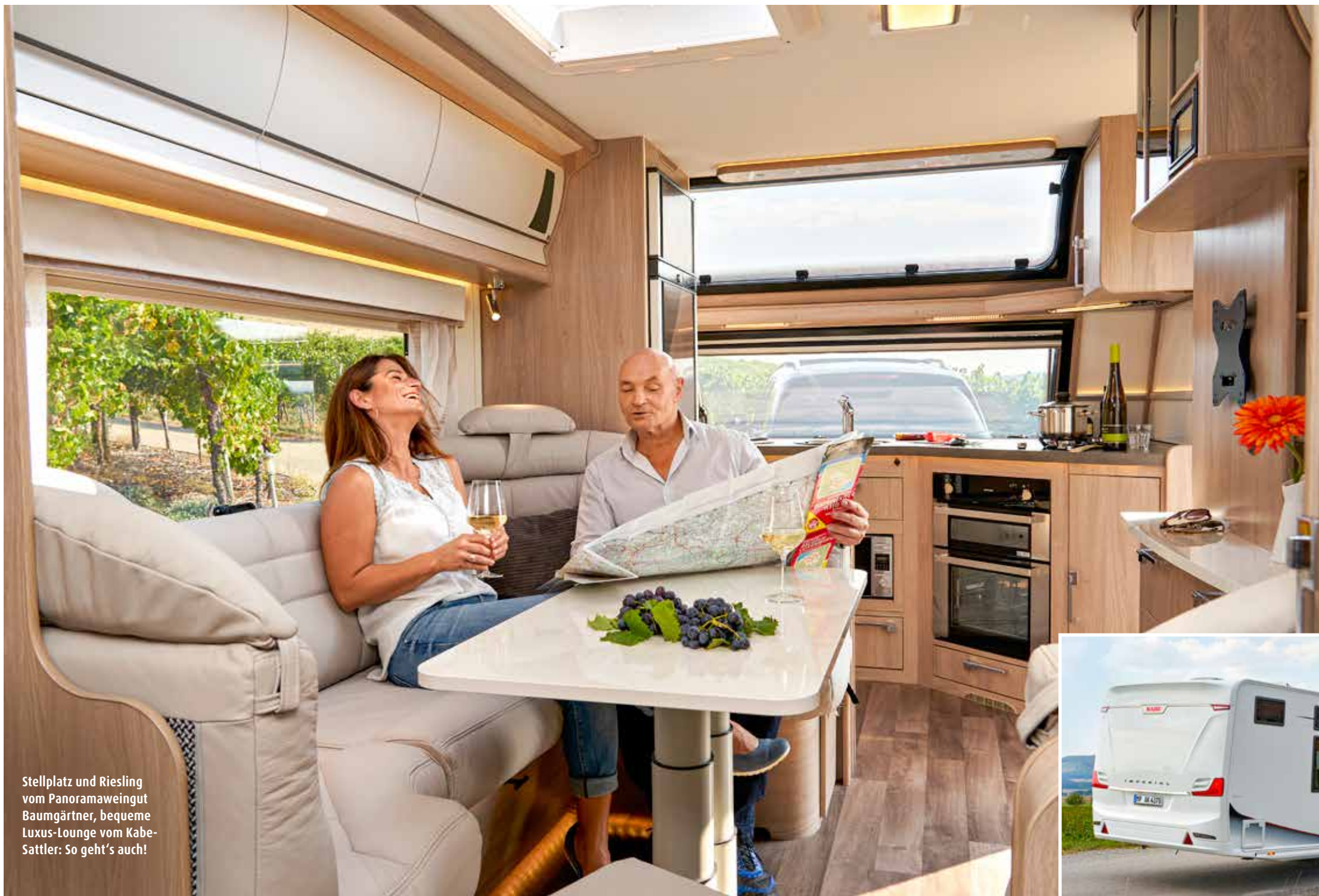
Stellplatz und Riesling vom Panoramaweingut Baumgärtner, bequeme Luxus-Lounge vom Kabe-Sattler: So geht's auch!