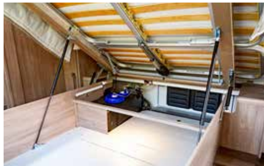
Der beleuchtete Bettstauraum mit unterlüftetem Innenboden, Abwassertank und Außenklappe.