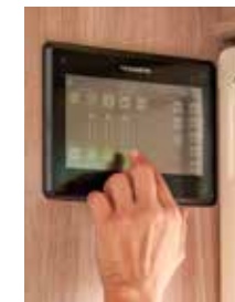
Alles steuern und im Blick dank Smart D.

Und trotzdem wünscht man sich etwas mehr Raffinesse bei der Verlegung der Kabelstränge, wenngleich im Falle eines Defektes alles schnell erreichbar ist. Selbst für den Klapp-Gaskastendeckel mit der hohen Ladekante hat Kabe eine Erklärung: Die Scharniere sparten Platz und der Deckel sei geprüft schnee- und wasserdicht. □